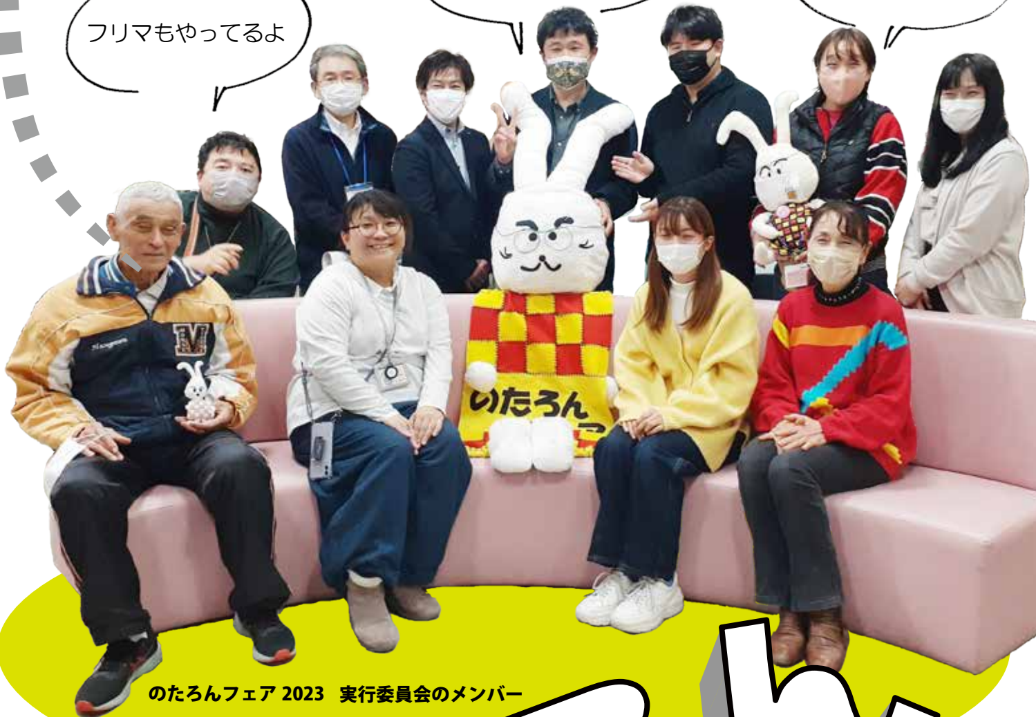
のたろんフェア 2023 実行委員会のメンバー