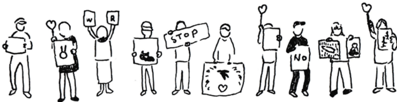
横須賀での「サイレントスタンディング」のスケッチです。個人の方々が思い思いのプラカードや光るライトを手に集まっていました。取材 2026/6/10

市民活動は「これ、どうにかならないかな？」から始まります。団体や大義がなくても意見を言えたり行動ができる。そういう今の時代を大切にしていきたいと願っています。（のたろん編集者）