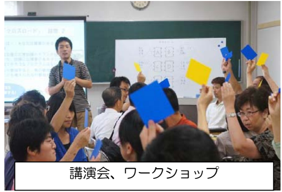
講演会、ワークショップ