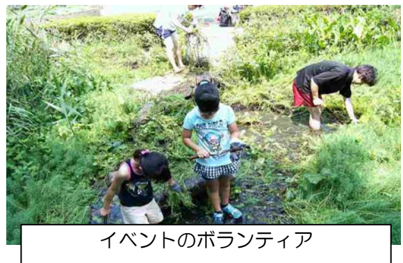
イベントのボランティア